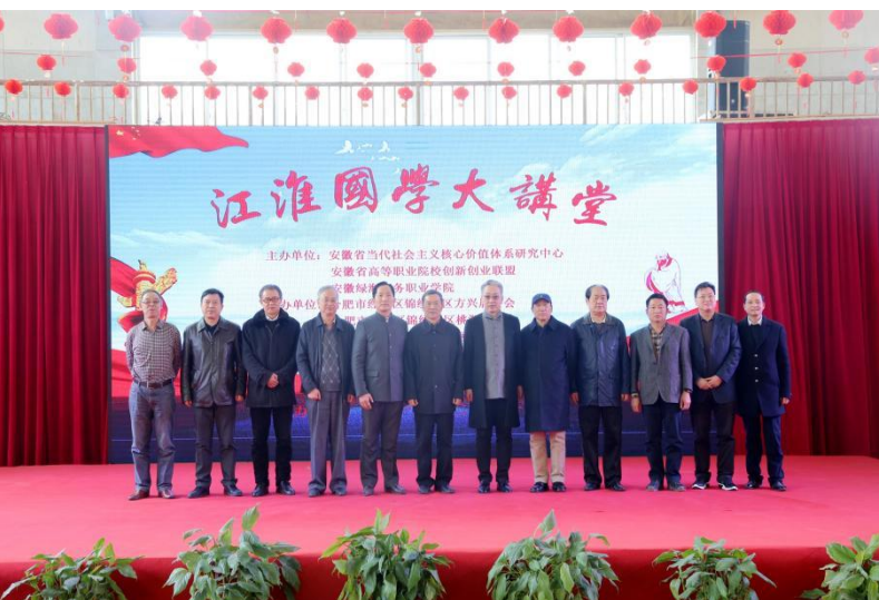
举办“江淮国学大讲堂”，集文化宣讲、传播、教育、交流等功能于一体，大力推动实施《中华优秀传统文化传承发展工程》，学院坚持立德树人，着力将中华优秀传统文化融入教育教学全过程。