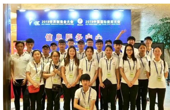
学院作为我省唯一的高职院校志愿团队受邀参与世界制造业大会服务活动