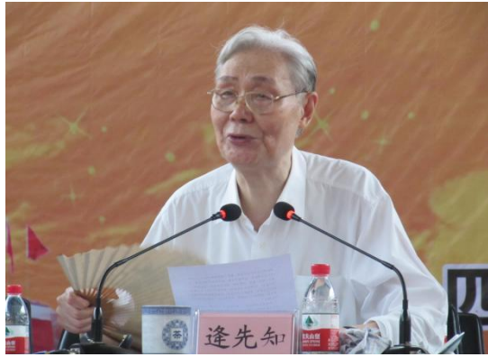
著名党史专家、中共中央文献研究室原主任逢先知来学院为师生作“毛泽东年谱”报告