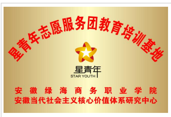
星青年志愿服务团培训基地

三是大力进行红色文化感悟践行。学院定期开展“追寻红色足迹，筑梦热血青春”的红色实践活动。每年暑期组织社会实践团队深入革命老区，追寻和探访革命足迹。学院组织 300 名学生徒步走进大别山，实地感受革命征程；坚持扎实开展重温红色经典活动。每学期举办“不忘初心红色之旅”等主题党日活动，通过组织诵读经典、传唱经典等方式，汲取文化养分，强化情感认同；注重在开展志愿者服务活动传承红色精神。先后服务过全国两会、世博会、中博会、世界制造业大会等近百次世界性、全国性会议。星青年学子发扬革命精神，以良好的形象、专业的服务、奉献的精神得到主办单位认可，多次荣获“安徽青年志愿者优秀组织奖”“最佳志愿团队”等荣誉称号，产生了良好的育人实效。