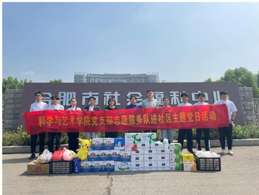
安徽蓝海商务职业学院科学与艺术学院党支部志愿服务队走进合肥市福利院开展主题党日活动

党员青年在市儿童福利院工作人员的带领下，参观了儿童生活、医疗、康复、娱乐等功能区，近距离了解了孩子们日常学习、生活情况，并为孩子们送上了牛奶和水果等慰问品，用实际行动向福利院的孩子们表达了真挚的爱心和关怀，让他们感受到了社会大家庭的温馨和关注。通过参观学习，科学与艺术学院党支部也详细了解了市儿童福利院建设发展情况，更加深刻地感受到儿童福利院工作团队的大爱精神。