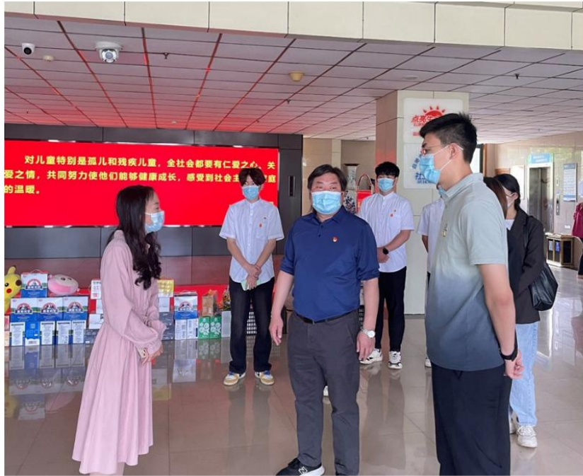
安徽蓝海商务职业学院科学与艺术学院党支部志愿服务队走进合肥市福利院开展主题党日活动

党员青年在市儿童福利院工作人员的带领下，参观了儿童生活、医疗、康复、娱乐等功能区，近距离了解了孩子们日常学习、生活情况，并为孩子们送上了牛奶和水果等慰问品，用实际行动向福利院的孩子们表达了真挚的爱心和关怀，让他们感受到了社会大家庭的温馨和关注。通过参观学习，科学与艺术学院党支部也详细了解了市儿童福利院建设发展情况，更加深刻地感受到儿童福利院工作团队的大爱精神。