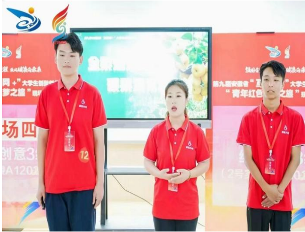
酥梨兴传团队的选手赛场英姿

绿海学院在本届大赛中获得佳绩，是学校不断推动创新创业教育与大学生思想政治教育相融合、与专业教育相融合，引导广大青年学子积极深入基层，用专业知识服务中国特色社会主义现代化建设，贯彻落实国家创新驱动战略的行动结果。同时也是星青年创新创业实践育人的成果，学校领导多年来重视创新创业教育工作的积累之功。