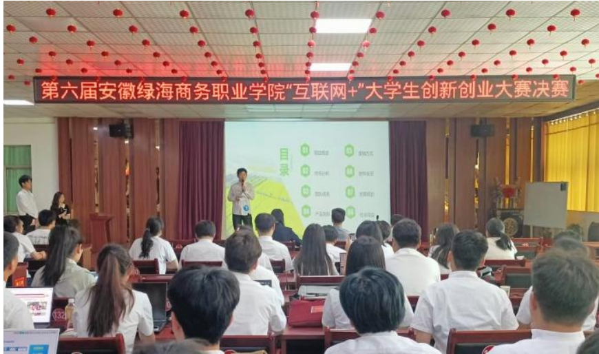
学校举办“互联网+”大学生创新创业大赛决赛

此次大赛，学校共组建 2066 个团队，约 12400 多人次学生报名参赛，经过学院初赛、学校决赛筛选，最终 24 个项目入围省赛。《凤鼓新声》、《酥梨兴传》、《甘农赴牧》、《芯旅慧导》等四支团队挺进省赛现场赛，最终，《凤鼓新声》项目闯入全省金奖排位赛，参加国赛名额争夺。本次大赛，全校近 4000 名大学生通过参加大赛上了一堂生动活泼、受益良多的思政教育大课和创新创业教育大课。