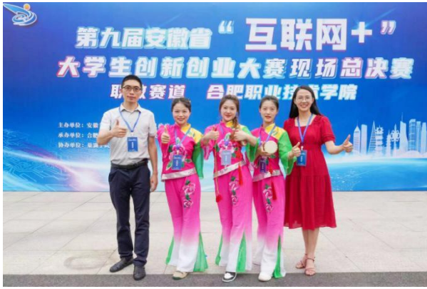
凤鼓新声团队勇夺国赛奖项