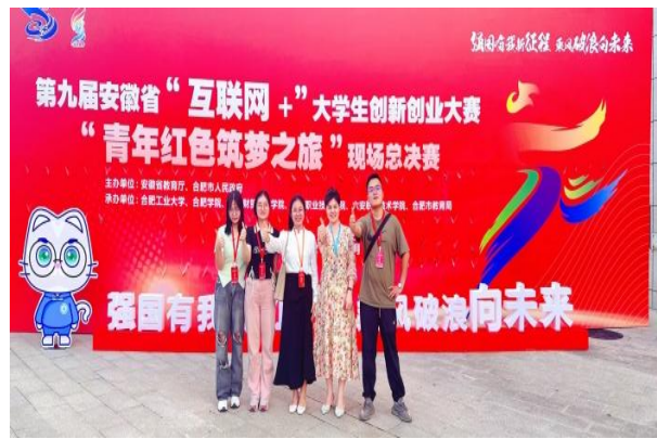
甘农赴牧团队荣获省赛银奖

此次大赛，学校共组建 2066 个团队，约 12400 多人次学生报名参赛，经过学院初赛、学校决赛筛选，最终 24 个项目入围省赛。《凤鼓新声》、《酥梨兴传》、《甘农赴牧》、《芯旅慧导》等四支团队挺进省赛现场赛，最终，《凤鼓新声》项目闯入全省金奖排位赛，参加国赛名额争夺。本次大赛，全校近 4000 名大学生通过参加大赛上了一堂生动活泼、受益良多的思政教育大课和创新创业教育大课。