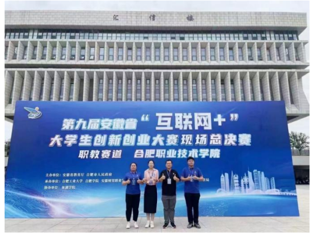
智慧旅游的先行者——芯旅慧导